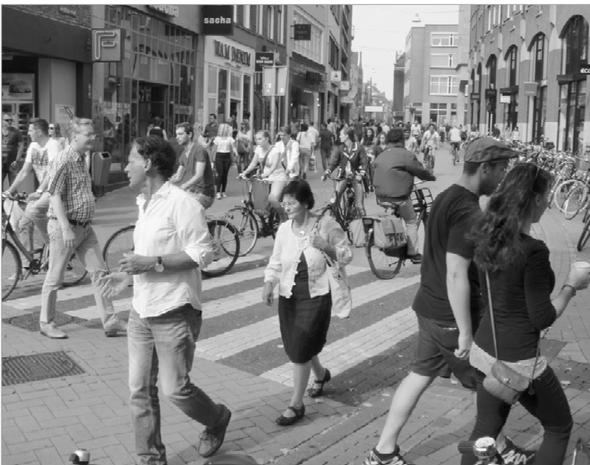
Oversteek tussen de Vismarkt en Tussen beide Markten.

zal ook bij de herstructurering van het stationsgebied aandacht aan geschonken moeten worden.