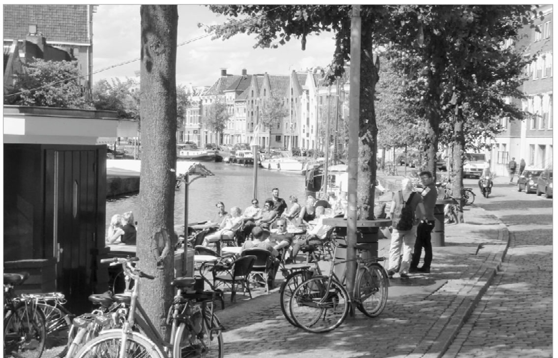
Terras aan de Hoge der A

Met deze overwegingen hopen de Vrienden van de Stad Groningen op het lustrumcongres aandacht te vragen voor de toekomst van de binnenstad van Groningen: wat zijn trends waarmee de stad te maken heeft, wat zijn mogelijkheden om daarmee om te gaan, welke instrumenten zijn beschikbaar of moeten worden ontwikkeld, welke keuzen dienen te worden gemaakt, wat is, kortom, de toekomst van de binnenstad onder het regiem van een dreigende verminderde attractiviteit?