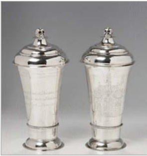
Avondmaalsbekers uit 1772; FOTO: MARTEN DE LEEUW, GRONINGEN MUSEUM.

Illustratie bij het artikel van Egge Knol over het avondmaalsgerei en het doopvont in hier genoemde boek