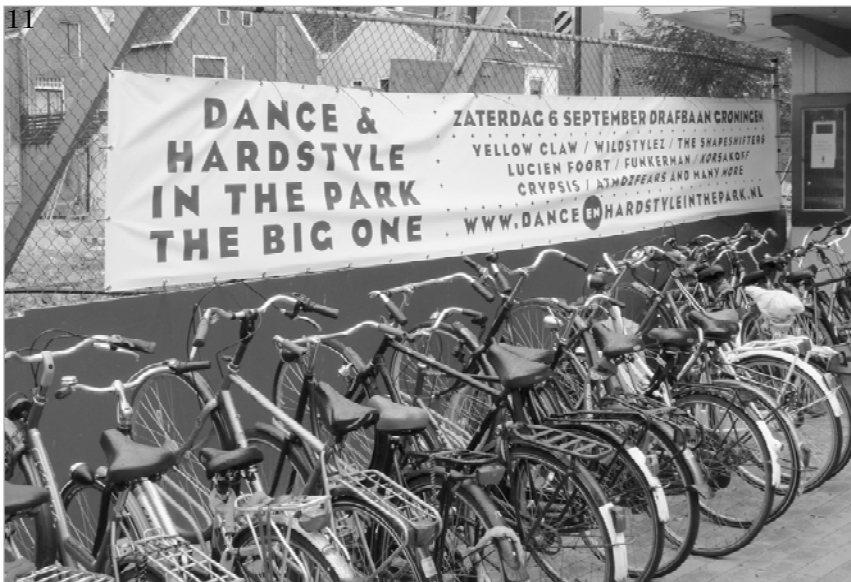
Fietsen en evenementen