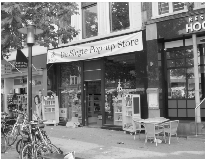
Pop-up shop aan de Vismarkt zuidzijde

In zijn streven om de universiteit (en daarmee ook de student) van dienst te zijn, of althans een prettig verblijfskli-