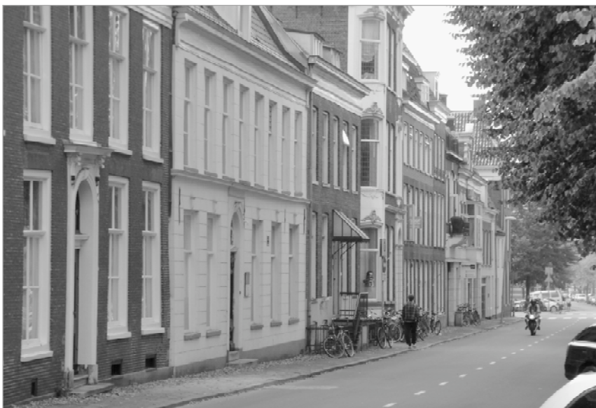
Voetganger langs Noorderhaven

ren voor de prijsstellingen van het vastgoed. Mogelijk kan ook het wonen in de binnenstad weer meer in zicht komen, maar dat vergt dan wel een andere aanpak van het evenementenbeleid.