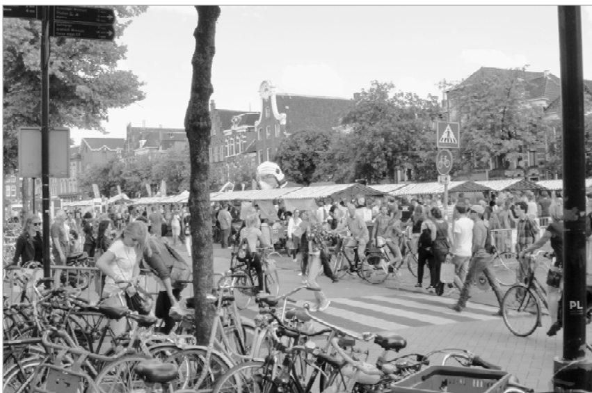
Drukke op de Vismarkt in Keiweek

afstemming van vorm en beoogde functie. Binnensteden als die van Groningen zijn niet alleen een historisch relict. Er vindt nieuwbouw plaats. Er vinden - gelukkig - allerlei activiteiten plaats. Men komt er werken, winkelen, onderwijs volgen. Toeristen komen voor het steden-schoon en de stedelijke atmosfeer. Er worden bioscopen, theaters, en wat niet al bezocht. Dat de binnenstad van Groningen nog zoveel historische aspecten kent is een belangrijke attractiefactor. Maar de activiteiten zelf dragen ook bij aan het in stand houden en ontwikkelen van de gebouwde omgeving.