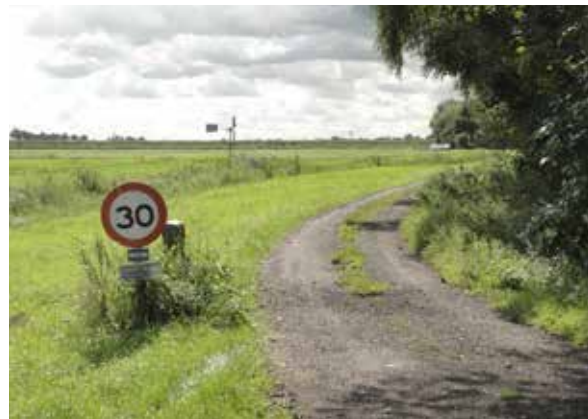
Driegemeentepunt, Meedenweg/noordelijke dijk Eemskanaal

158,77 km 2 en was daarmee na Vlagtwedde (170 km 2 ) in (land)oppervlakte de tweede gemeente van Groningen. Op 1 januari 2018 werd Slochteren met Hoogezand-Sappemeer en Menterwolde samengevoegd tot de gemeente Midden-Groningen. De oppervlakte van de nieuwe gemeente is daarmee 295,77 km 2 , ongeveer twee maal het 'oude' Slochteren. Naar bevolkingsgrootte is Midden Groningen de derde gemeente van Groningen, met 61.000 inwoners net even kleiner dan Westerkwartier. De grootste kernen zijn Hoogezand (22.000), Sappemeer (8000) en Muntendam (4600). Ook naar werkgelegenheid (22.000 banen) staat Midden Groningen op plaats drie, na Groningen en Westerkwartier.