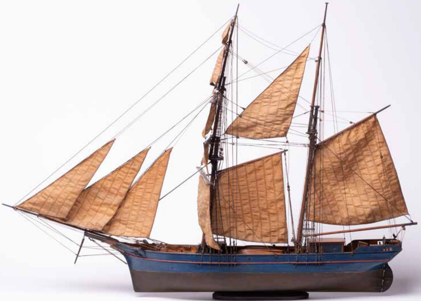
Scheepsmodel van de schoenerbrik 'Paul Johannes', 2 e helft 19 e eeuw. Collectie museum aan de A.

jaarlijks een tiende van het geleende af te lossen. De scheepvaartjournalist Ad Boerma typeert de situatie aan boord van de schepen aldus: "Ieder persoonlijk was door het hebben of door het graag willen hebben van een schip zeer bij de gang van zaken betrokken. Men werkte er voor dag en nacht. In noodweer vaak, men zwoegde door de lage vrachten heen en men plukte soms de verdiende vruchten van de hoge vrachten. Zo is de kustvaart in de provincie Groningen gegroeid. Hard werken, sober leven en sparen."