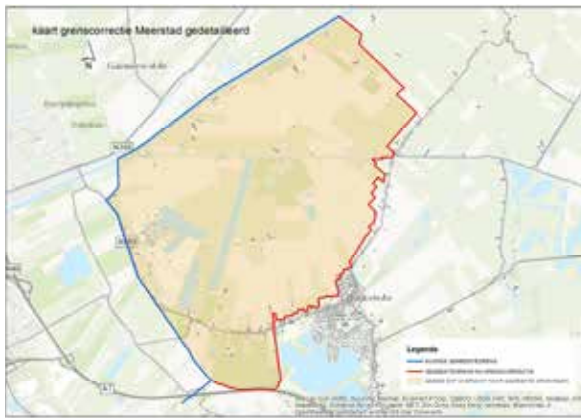
Het gebied Meerstad 'aan de overzijde' van het Eemskanaal.

ding tussen Groningen en de zee (ter vervanging van die langs het Reitdiep) en verbetering van de waterafvoer van het Drents Plateau (dat door de ondoorlatende keileemlaag een snelle afvoer van het hemelwater kent) en van de veenkoloniën. De aanleg gaf de nodige problemen: de instabiele (venige) ondergrond zorgde voortdurend voor verzakkingen. Uiteindelijk is het kanaal wat breder geworden dan gepland; en er is een beroep gedaan op de in Groningen bij de slechting van de vestingwallen vrijgekomen grond. Per slot van rekening kwamen de aanlegkosten ruim op het drievoudige van de begrote uit, zo schrijft Meindert Schroor in Wotter .