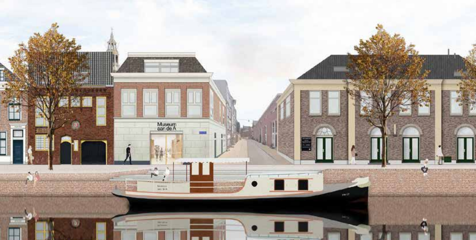
Museum aan de A, nieuwe entree aan de Kleine der A.

een aantal van hun vergaderingen in ons museum plaats. Met Noorderpoort overleggen we natuurlijk ook over die nieuwe vaste presentatie; zij zullen daar ook met studenten aan mee gaan werken. Daarnaast is Museum aan de A als het straks heropend is na de verbouwing, een leer-werkplek en leslocatie voor studenten van Noorderpoort.