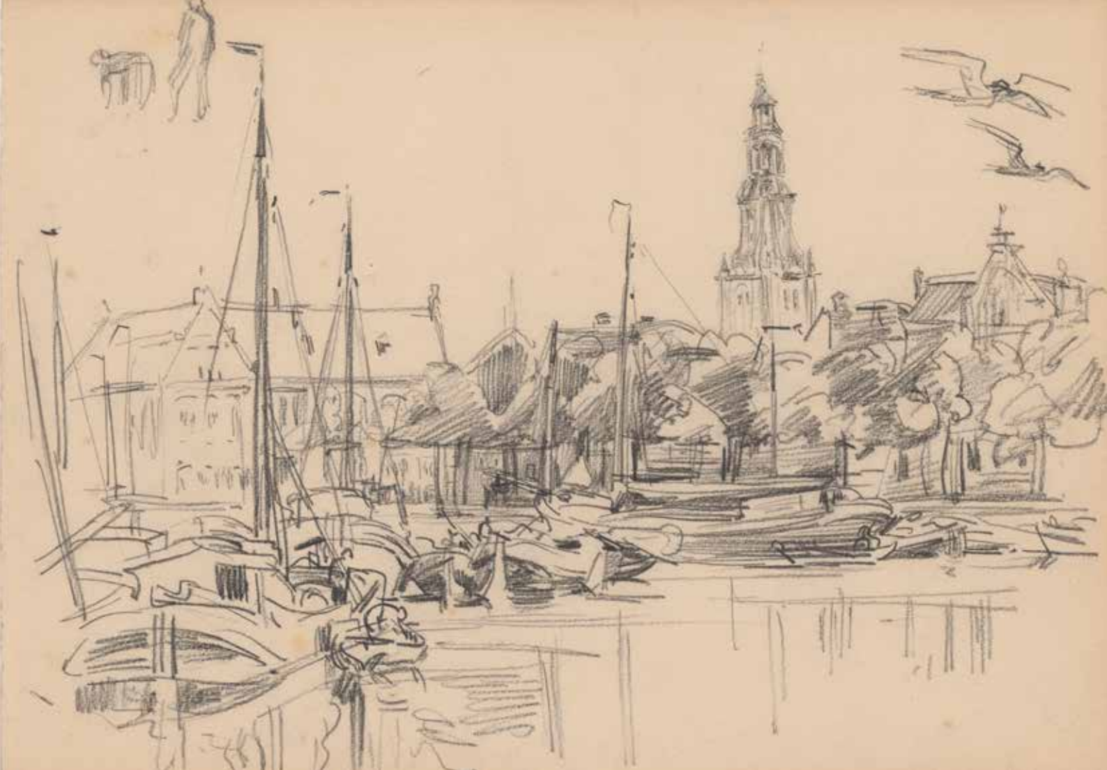
Het Groninger Museum gezien van over het water. Rechts op de achtergrond de toren van de A-kerk