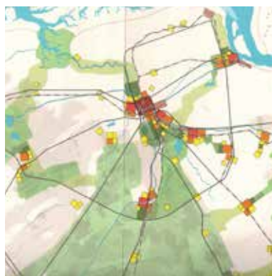
De blokjeskaart, Tweede Nota RO

Over de Tweede Nota over de Ruimtelijke Ordening het volgende: onder planologen is die nog steeds een nota 'om blij van te worden'. Duidelijk, handzaam, mooi uitgevoerd, een optimistische ondertoon met evenzogoed nog steeds actuele waarschuwingen op het vlak van milieu. Wel ont-