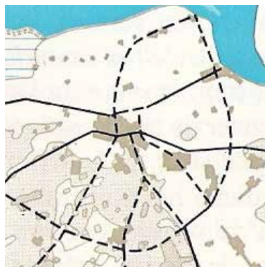
Structuurschema hoofdwegen 1966