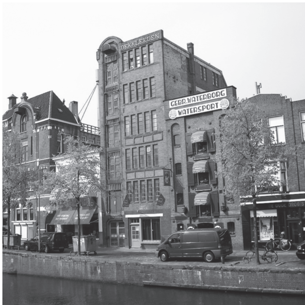
Bedrijf Waterborg aan Lage der A

Vrijwel elke Groninger kent of kende, in ieder geval van naam, het bedrijf Waterborg, gevestigd aan de Lage der A en ook in de A-straat. Het heeft 125 jaar in de binnenstad gezeten. Begonnen als zeilmakerij heeft het bedrijf zich allengs verbreed met andere