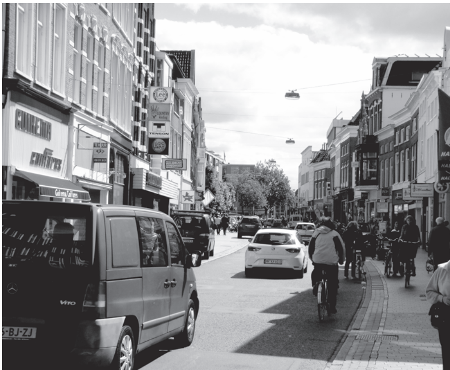
Oude Ebbingestraat: mooi dat de straat blijkbaar aantrekkelijk is, maar er zijn grenzen aan het opnamevermogen

In hoofdstuk 1, Ambitie, wordt de plaats van de binnenstad geschetst: de stad groeit, de regio krimpt en daarom neemt het draagvlak voor binnenstedelijke voorzieningen toe. En de binnenstad heeft zelfs een rol als "economische motor van het noorden". Aldus 'Bestemming Binnenstad'. Wat betreft de krimp van de regio: dat daarmee de Groninger binnenstad een groter draagvlak zou krijgen valt te betwijfelen. Minder mensen in het ommeland wijst nu niet direct op een groter draagvlak. Afnemende bevolking in Oost-Groningen zal de voorzieningen aldaar raken in hun functioneren en voortbestaan, maar of de Hongerige Wolfster of de Schaapbultenaar (meer) naar de Groninger binnenstad zullen komen... Veeleer is te verwachten dat het in het gebied zelf tot een herschikking van bovenlokale voorzieningen komt. Het geld zal daar besteed blijven worden. Daarvoor biedt het gebied voldoende mogelijkheden in Delfzijl, Appingedam, Winschoten, Ter Apel, Stadskanaal, Veenendam en Hoogezand.