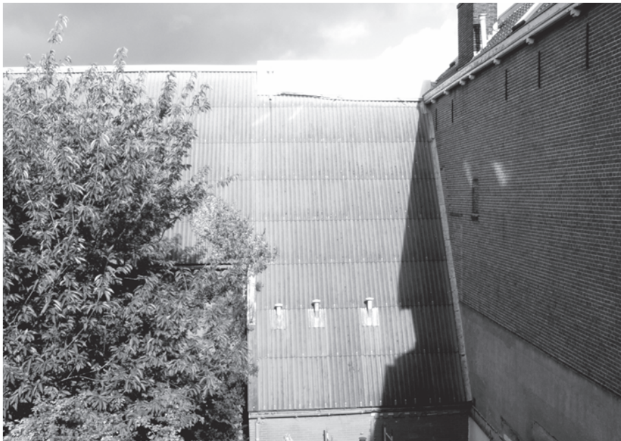
Afb. 3. Achterkant van de Wibra in de Pelsterstraat, woonhuis van de kunstenaar H.N Werkman van 1912 tot 1930. Van 1912 tot 1922 was daar zijn drukkerij gevestigd.

Er blijven nog wensen over. Mensen die in de binnenstad wonen willen niet alleen een aantrekkelijke woning aan de voorkant, maar ook een aantrekkelijk uitzicht vanuit hun achterrazen (Afb. 3). Wonen in de binnenstad en de schilwijken is niet aantrekkelijk wanneer er geen plan komt om de aantastingen aan de achterzijde van woningen aan te pakken of nieuwbouw op binnenplaatsen te voorkomen. De recente bouwplannen voor de binnenplaats van het Pythagorascomplex aan de Louïse Henriëttestraat laten zien dat zo'n plan noodzakelijk is.