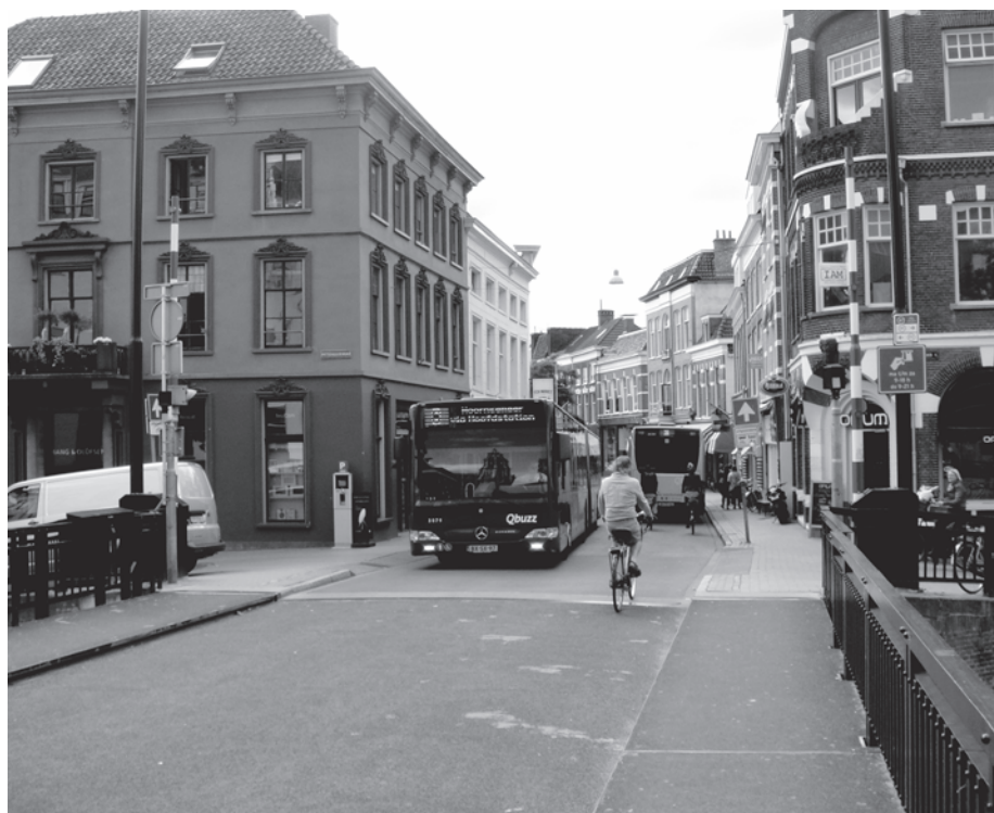
Brugstraat: de bus er uit, dat zou opluchten!