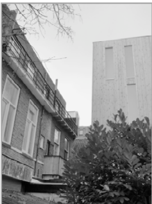
Toren achter Hoendiep 53

Zeker, de wethouder heeft formeel volkomen gelijk met zijn verwijzing naar de inspraakprocedure bij het bestemmingsplan. Maar de indruk heeft postgevat dat de gemeente de hotelonderneming teveel faciliteert en het plan ook zijn plan is geworden. Hoe vrij is de gemeente nog in zijn rol als de instantie die bij de vaststelling van het bestemmingsplan de belangen van alle betrokkenen meeweegt. De vergadering komt er deze avond niet uit hoe een dergelijke situatie aan te pakken. In ieder geval verzekert de wethouder dat er naar de burgers goed geluisterd zal worden hoewel dat natuurlijk niet wil zeggen dat er altijd aan hun verlangens zal worden voldaan. Hoe lastig het wordt voor de wethouder indien het gemeentebestuur twee heren dient zoals nu bij de welstand gebeurt, namelijk die van inhoudelijke begeleider van de aanvrager van de omgevingsvergunning en die van afweiger vanuit het algemeen belang, moge uit de optredende verwarring bij het terras- en paviljoenplan aan het Hoornsemeer duidelijk zijn.