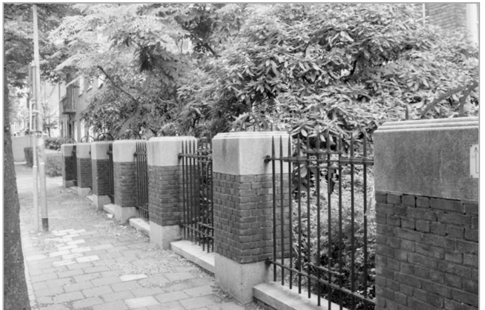
Hek van de Christelijke HBS in de Rozentraat, FOTO: OKKO VELING