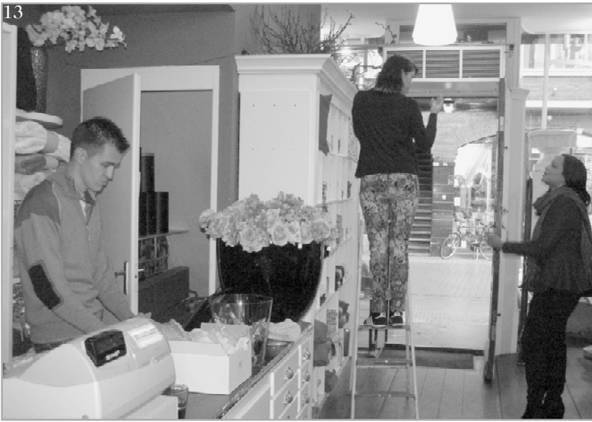
De winkeliers van de pop-up winkels zijn erg enthousiast.