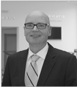
Andreas Blühm © Groninger Museum

Pierre Bonnard, Raam in Uriage , 1918, olieverf op doek, 68,5 x 39,2 cm © Collectie Rau voor UNICEF FOTO: P. SCHÄLCHLI, ZÜRICH