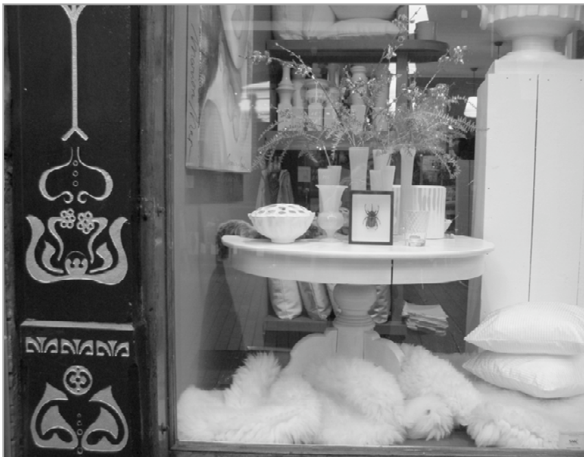
Zwanestraat 9 Kerstetalage