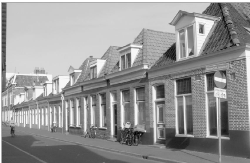
Waardevol ensemble in de Nieuwe St. Jansstraat

Nieuw is ook dat het bestemmingsplan aandacht heeft voor gave ensembles van panden in een straat die een duidelijke cultuurhistorische waarde hebben. Als voorbeeld wordt de rijtjesbebouwing in de Nieuwe Sint Jansstraat ten tonele gevoerd, waar nog een gave straatwand van eenlaagshuisjes met kap bestaat. Op de plankaart wordt de maximale bouwhoogte voor het desbetreffende deel van de straat vastgelegd op 7 meter en de goothoogte op 4 meter. Dezelfde maatvoering vindt men terug in een stukje van de Agricolastraat en van de Oosterhavenstraat op het Eiland . Alleen als het college van B en W niet van zijn afwijkingsbevoegdheid gebruik maakt waardoor wordt toegestaan dat een huis met een verdieping wordt opgeplust, blijft het ensemble in stand. Dit brengt me tot de vraag waarom niet alle ensembles van het plangebied onder het regiem worden gebracht van de specifieke bouw aanduiding-2 . Deze aanduiding geeft namelijk B. en W. geen afwijkingsbevoegdheid van de op de plankaart vermelde normen. Gevoegd bij het aanhouden van de bestaande bouwhoogte is dan het ensemble echt beschermd. Nu