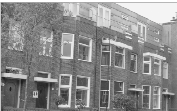
Opbouw in de Ernst Casimirlaan

De beschreven collegebrief straalt urgentie uit. Nu nog de praktijk!