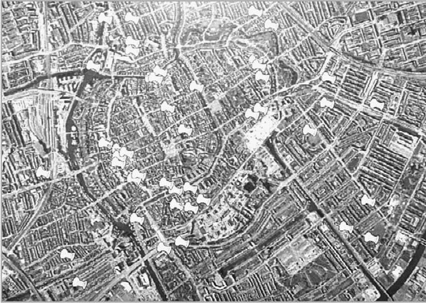
Overzicht van 52 plannen in 2010 voor jongerenhuisvesting op binnenterreinen in oude delen van de stad.

foto gemarkeerd. En dat alleen al voor de projecten, afkomstig van de twee grootste bouwtechnische tekenbureau's van de stad. Dan komt men tot een totaal van 52, waarvan het grootste deel binnen de 17e-eeuwse wallen. Het gaat om een duizendtal wooneenheden, dus gemiddeld 20 wooneenheden per project, geschikt voor de huisvesting van jongeren, lees studenten. Dat dit allemaal kan, komt vanwege het huidige ruimtegevendende bestemmingsplan en de welstandscommissie stelt nu de vraag, of de stad met al deze ontwikkelingen, op termijn wel gebaat zal zijn.