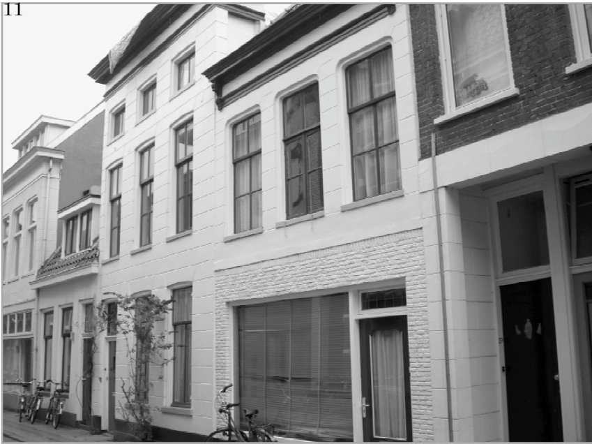
De woningen aan de Visserstraat voor de sloop

panden in zijn omgeving. Het gebouw zal het karakteristieke beeld van de rij gevels aan de Hoge der A, met het kenmerkende ritme van hoogtes, volumes en daken verstoren.