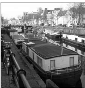
Woonarken in het loopende diep

Veertig jaar terug was de Noorderhaven in de zomer nog goeddeels leeg: dan trokken de scheepseigenaren met hun authentieke (bedrijfs)schepen het wijde Groningse land in om in de herfst terug te keren en in de haven te overwinteren. Sindsdien is het aanzien van de Noorderhaven sterk achteruit gegaan. De regelgeving bleek tegen de neerwaartse ontwikkeling niet opgewassen en er werd bovendien slecht gehandhaafd. Hoe weer grip te krijgen op de situatie en de oude beeldkwaliteit terug te winnen?