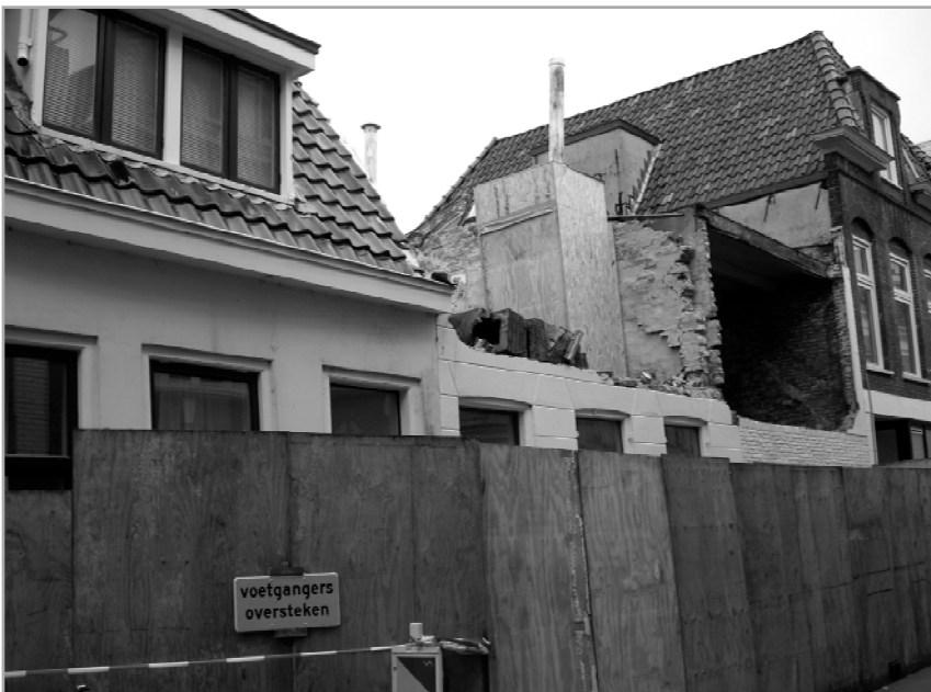
De woningen aan de Visserstraat tijdens de sloop

Het gaat hier om lage pandjes van een of twee bouwlagen, behalve in de Grunobuurt waar het gaat om gebou-