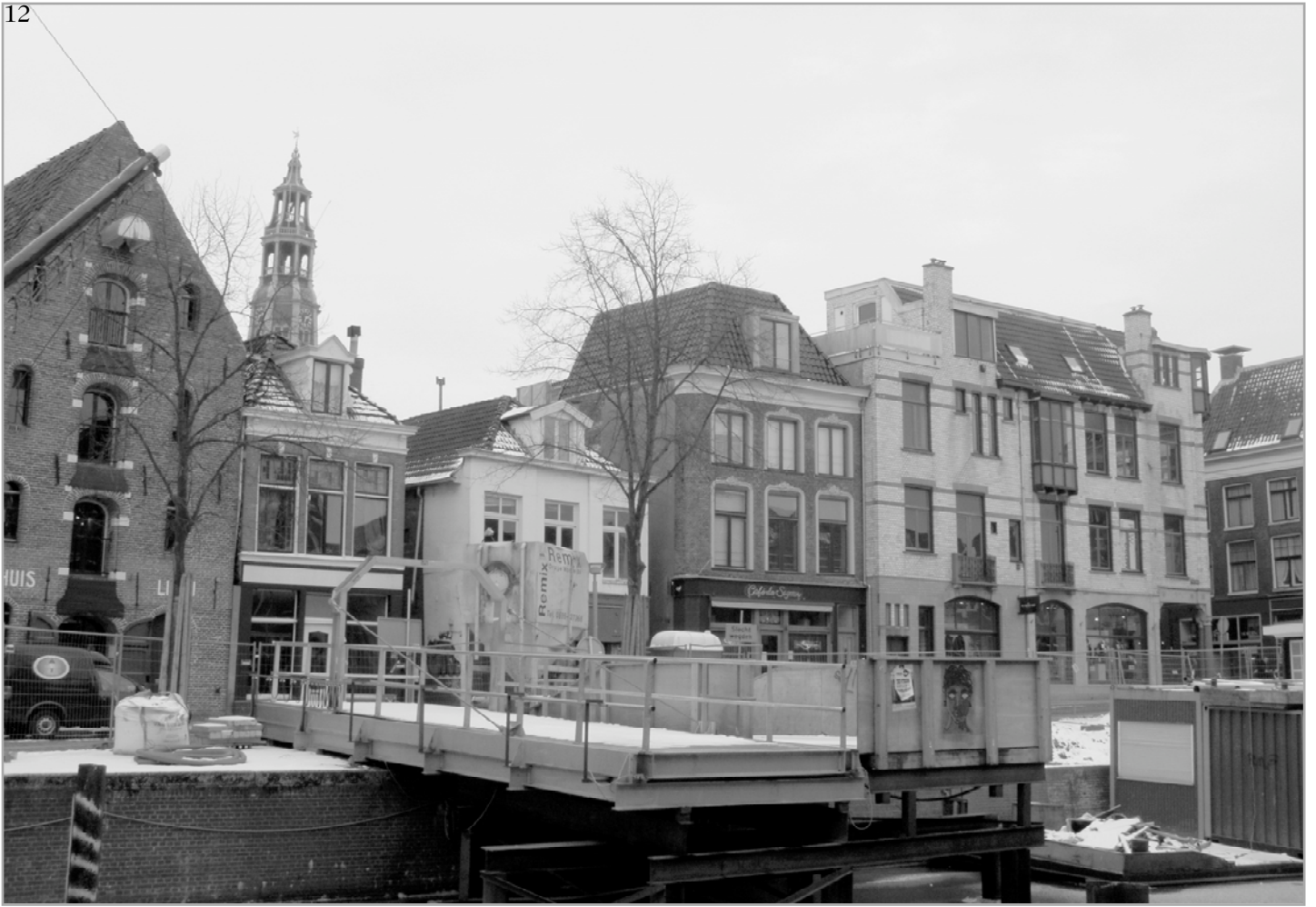
Hoge der A 3 en 4

Behalve de hoogte kent het bestemmingsplan nog meer grenzen waar men zich aan moet houden.