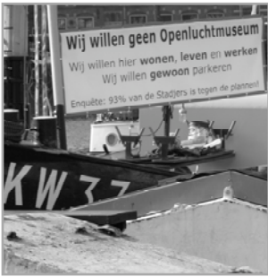
Spandoek in de Noorderhaven

en de wekelijkse inzet van de drijvuilboot Rodina blijkt ontoereikend. Maatregelen op het gebied van de duurzaamheid en de veiligheid ontbreken natuurlijk niet in dit hedendaagse plan. Onvolledige ontbranding van het hout in de talrijke houtkachels aan boord van de schepen betekent extra fijnstof in de lucht boven de kades en het water. De gemeente overweegt roetfilters voor te schrijven. Een probleem voor de veiligheid vormen de gasflessen aan boord van de schepen die als trossen in de haven zijn aange-meerd.