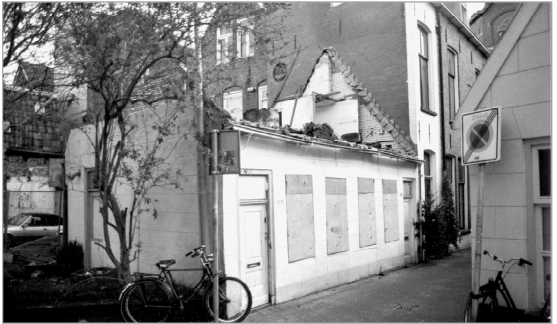
Tijdens de sloop Nieuwe weg 38-26 en 38-27

20% verhogen. Dan zou de vloerindex dus 4,8 worden; dat betekent een penthouse erbij.