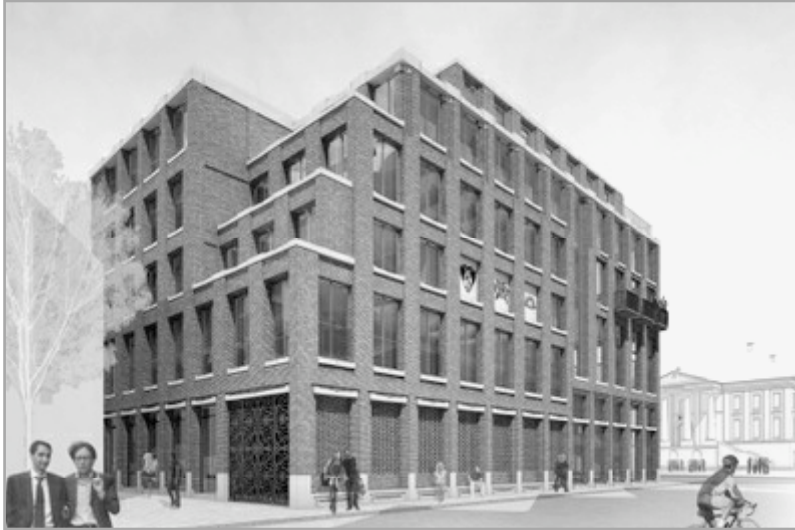
Mutua Fides, ontwerp: De Zwarte Hond