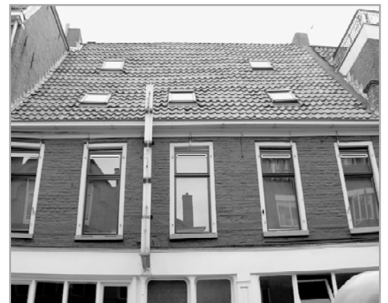
De bovenetage van Gelkingestraat 20 met een dak evenwijdig aan de weg:

le middeleeuwse steenhuizen hadden gestaan. Het gaat onder andere om de panden waar nu Drie Gezusters en VERA in zitten. Dit waren verdedigbare panden die hoog uittorenden boven de omringende huisjes van één bouwlaag. Je kunt zulke steenhuizen nu nog vaak herkennen aan de bel-etages, die extreem hoog zijn, wel vier à vijf meter. Maar wat me verbaasde is dat er aan de Gelkingestraat ook een paar van die steenhuizen hebben gestaan. Ik dacht dat dit ooit een achterpad was voor de erven aan de Herestraat en de Oosterstraat, maar die bescheiden functie was rond 1250, 1300 kennelijk al passé.