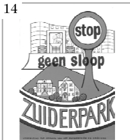
De grote poster die jarenlang in de voortuin van Zuiderpark 25 heeft gestaan

Het 4de hoofdstuk geeft de geschiedenis van een in de 16e eeuw gevestigde herberg buiten de Heerepoort, die voor het beleg in 1672 is geslecht, maar bij de herbouw de naam Brandenburg kreeg als eerbetoon aan de protestantse keurvorst van Brandenburg die de terugtrekking van Bommen Berend op 28 augustus van dat jaar veroorzaakte met de dreiging het Munsterse bisdom binnen te vallen. De beide Brandenburgerstraten zijn naar deze herberg genoemd.