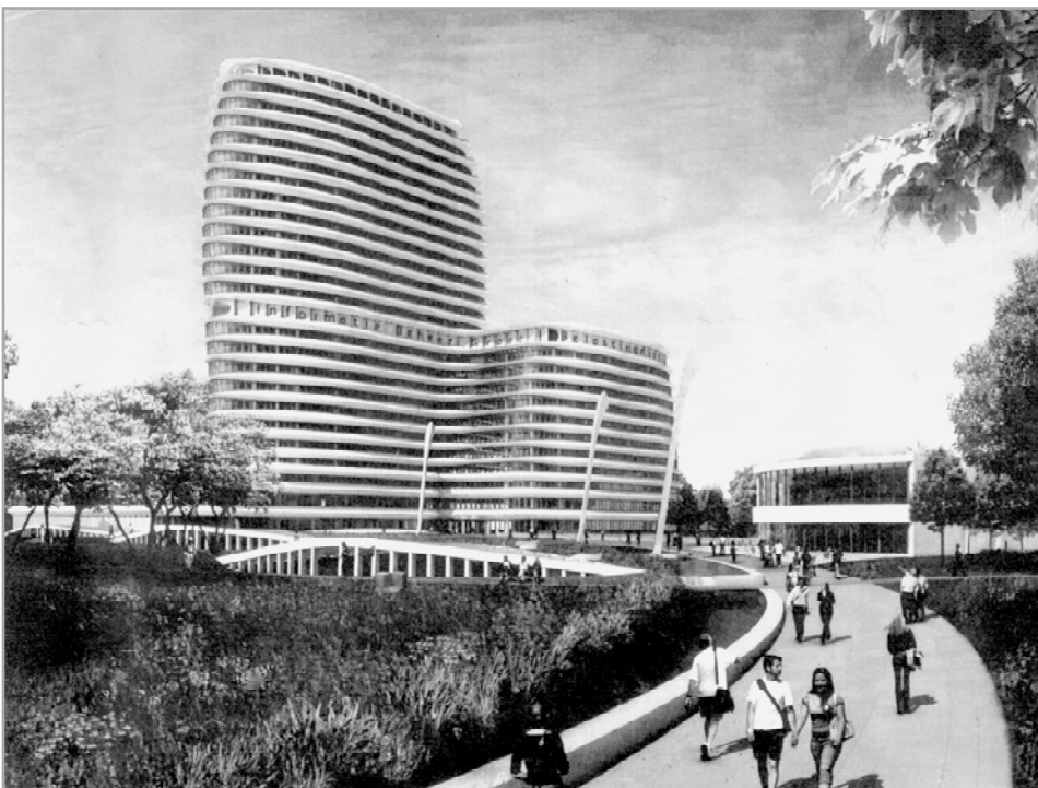
Artist impression van UNStudio van het kantorencomplex op de Kempkensberg

Het gaat mij hier niet zozeer om dit geval maar om deze kwesties in het algemeen en de naar het lijkt onvermijdelijke wrevel. Het bestuur van de Vrienden van de Stad heeft er een jaar geleden een discussieavond, een mini-sympo-