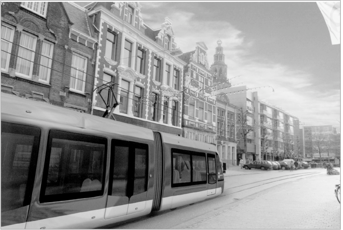
Tram in de Ebbingstraat, een suggestief plaatje uit 'binnenstad.nu', p. 20

We kunnen ons echter voorstellen dat er belangrijke brongebieden zijn waar een tram een goede oplossing kan bieden. We denken hierbij vooral aan Meerstad, een gebied waar ruim 10.000 woningen worden gebouwd, dat ver van het stadscentrum ligt en waar nog ruimte is om een trambaan aan te leggen.