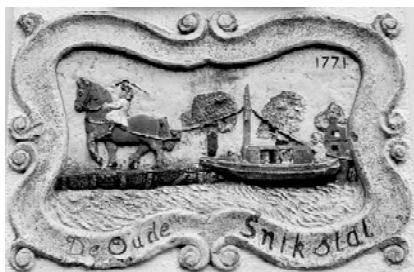
De gevelsteen nu

Op een negentiende-eeuwse kaart van de stad Groningen is bij het Boterdiep, even buiten de vestinggracht, een snikstal weergegeven. Hij staat aan het begin van de Trekweg naar de Ommelanden. Deze snikstal – een soort ‘herberg’ voor paarden – is in de loop der