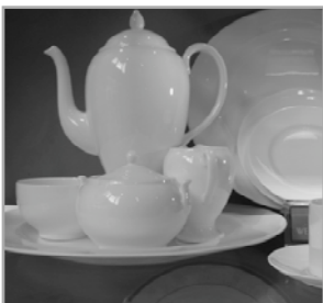
Wedgwood, White China

Na het vertrek van de meubelzaak uit de Stoeldraaijerstraat kwam de porseleinwinkel in dit pand. Voor de verkoop van porselein is deze locatie wel geschikt. Klanten die hun servies willen aanvullen kunnen zelf een paar kopjes, borden of glazen meenemen. Grote pakketten worden bezorgd via TNT post. Twee keer in de week worden de pakketten opgehaald. Wel zijn er toch weer problemen met laden en lossen bij Woldring in de Stoeldraaijerstraat. Toen Hoiting de zaak in 2006 overnam, kon de vergunning hiervoor niet verlengd worden. De winkel wordt nu bevoorradt op de daarvoor geldende tijd, 's ochtends voor 11 uur.