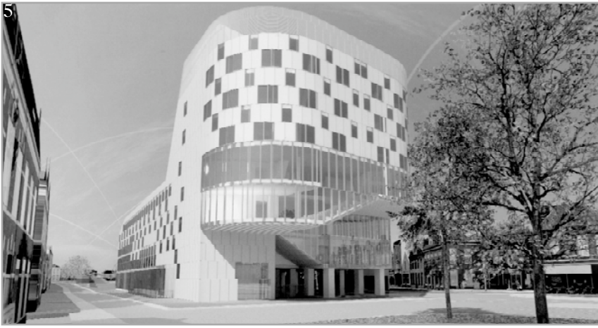
5 Bovenbouw parkeergarage Damsterdiep straks, 'binnenstad.nu', p. 18

de ruimte op transferia en beperkte ruimte in de binnenstad.