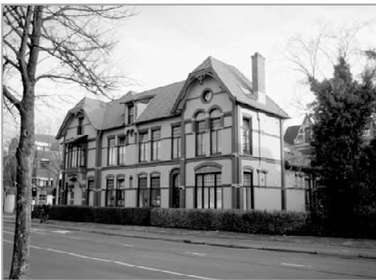
Villa Zuiderpark 18, waarin ruim een eeuw lang Apotheek Tonella was gevestigd

In Hoofdstuk 1 worden in een “architectuurwandeling door en langs het Zuiderpark” aan de hand van een plattegrond de architectonische bijzonderheden van de panden stuk voor stuk beschreven. De bouwkundige termen worden in een aparte lijst verklaard.