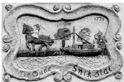
De gevelsteen zoals hij eruit zag voor de verfbeurt

Gemeente word wakker en getuig van uw (be)zorg(dheid) voor dit historisch erfgoed!