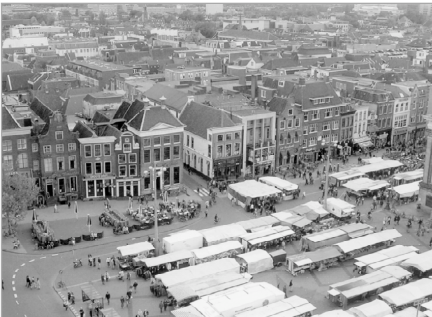
Luchtfoto Grote Markt, 'binnenstad.nu', p. 22

De inrichting van de openbare ruimte zal geschikt moeten zijn voor markten, manifestaties, kermissen etc. Dat zou een belangrijk uitgangspunt voor het beleid moeten zijn.