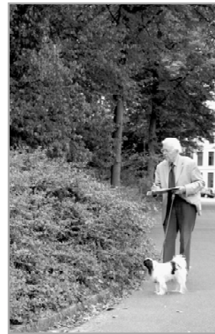
Auteur Kremer maakt aantekeningen over de Vuurdoorn

In Hoofdstuk 2 gaat J.Kremer uitvoerig en minutieus in op de bomen en andere planten in het park. Zijn liefde voor de