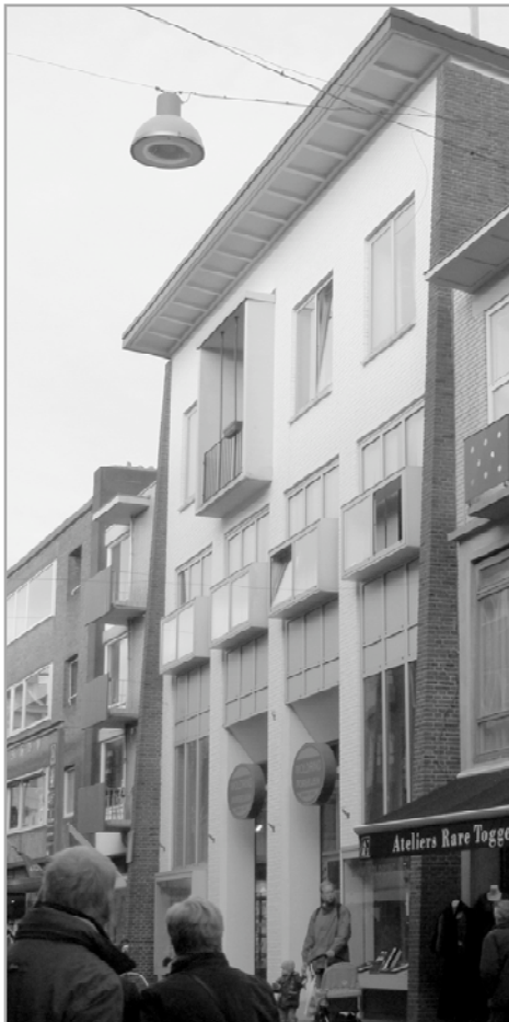
Het hoge, witte gebouw is Stoeldraaiersstraat 25

De porseleinwinkel van Woldring is gevestigd in het fraaie pand Stoeldraaiersstraat 25. Het is een wederopbouwmonument, gebouwd door de architect Vegter voor 'de Arbeiderspers' in de jaren 1951-1955.